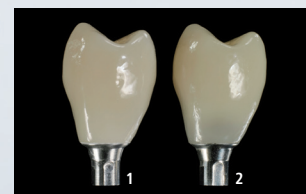
Raffronto tra corona abutment ibrida incollata con Multilink Hybrid Abutment HO 0 (1) e con cemento di opacità convenzionale (2).