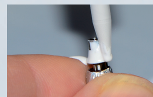
Applicazione di Multilink Hybrid Abutment alla Ti-base.