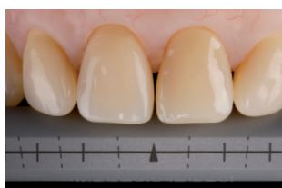
Scala di riferimento 1