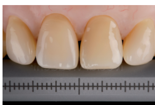
Scala di riferimento 2