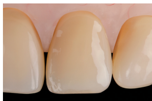
Risultato finale con OptraSculpt Pad

I pad anti-appiccicosità di OptraSculpt Pad consentono di adattare e modellare i compositi con facilità, senza lasciare indesiderate tracce sul restauro. Con assoluta efficienza e rapidità si realizzano restauri dalle superfici omogenee e levigate.