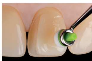
Modellazione con OptraSculpt Pad

OptraSculpt® Pad è uno strumento per la modellazione dagli speciali puntali „Pad” in spugna di polietilene, appositamente formulato per la lavorazione e la modellazione dei compositi senza appiccicare.