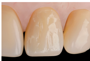
Risultato finale con spatola in metallo