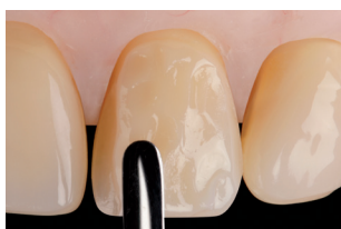
Modellazione con spatola in metallo